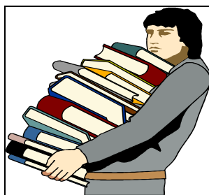
Figura 1: Aluno carregando livros para escrever a sua monografia.